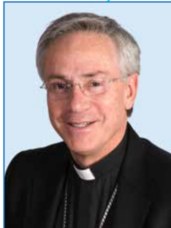
† Romà Casanova i Casanova Bisbe de Vic

En conclusió, la veritable riquesa de l'Església són els sants. Per consegüent, el que em pertoca de dir és senzillament, i ho repeteixo: «Tu també pots ser sant». Sigues dels qui tenen clar que l'única cosa que es pot considerar un fracàs en aquesta vida és no ser sant. Viu amb autenticitat el seguiment de Crist –la que cerquen els joves en aquest moment d'incertesa– i, d'aquesta manera, aportaràs el millor de tu mateix a l'Església, perquè seràs en camí de santedat i de missió.